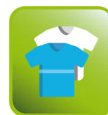
Anti Crease - ochrana proti pomačkání prádla