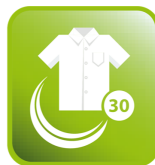
Program Košile 30'